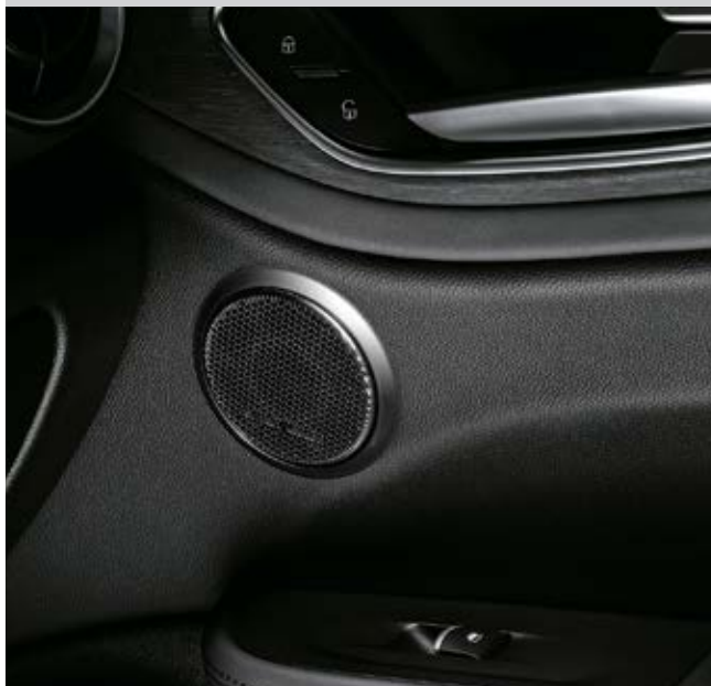
SOUND THEATRE BY HARMAN / KARDON®